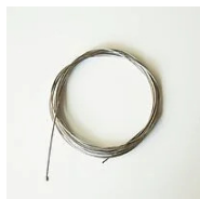
526 Cavo di sospensione per binario elettrificato