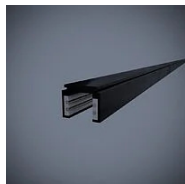
593J Binario elettrificato