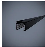
519 Binario elettrificato