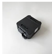
500X Dispositivo Push-Dali