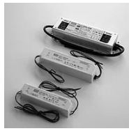
5142.1 Alimentatore remoto