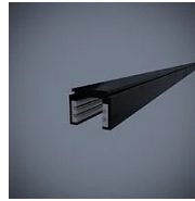
521 Binario elettrificato