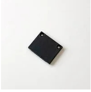
523 Testa di chiusura