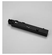
522 Alimentazione 48 V per binario elettrificato