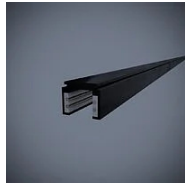
520 Binario elettrificato